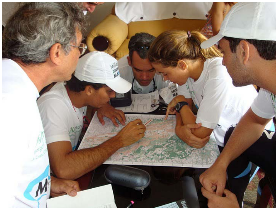
Planejamento e estratégia são fundamentais na corrida de aventura