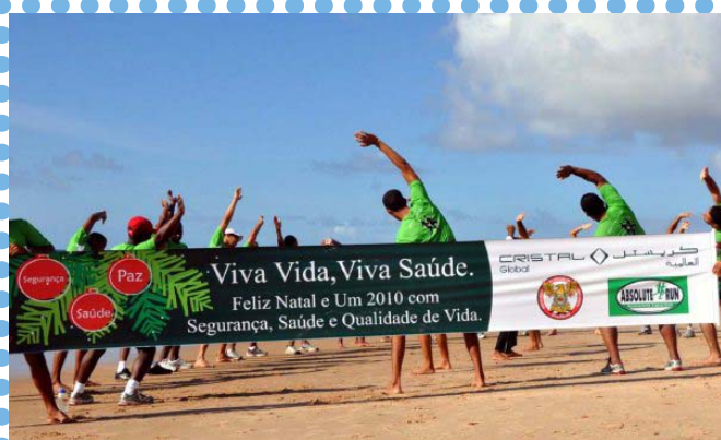
Momento de integração e saúde: com treino corrida no dia 19 de dezembro, Absolut Run marcou o encerramento do ano

Neste contexto, as corridas de rua vêm conquistando cada vez mais adeptos em todo o país. Estudiosos dizem que isso acontece pela acessibilidade, baixo custo e popularidade do esporte, bem como pelos benefícios à saúde e ao condicionamento físico das pessoas. Além disso, segundo a Associação Internacional de Maratonas e Corridas de Rua, a atividade fortalece o convívio social e vem crescendo mais como um comportamento participativo do que como esporte competitivo.