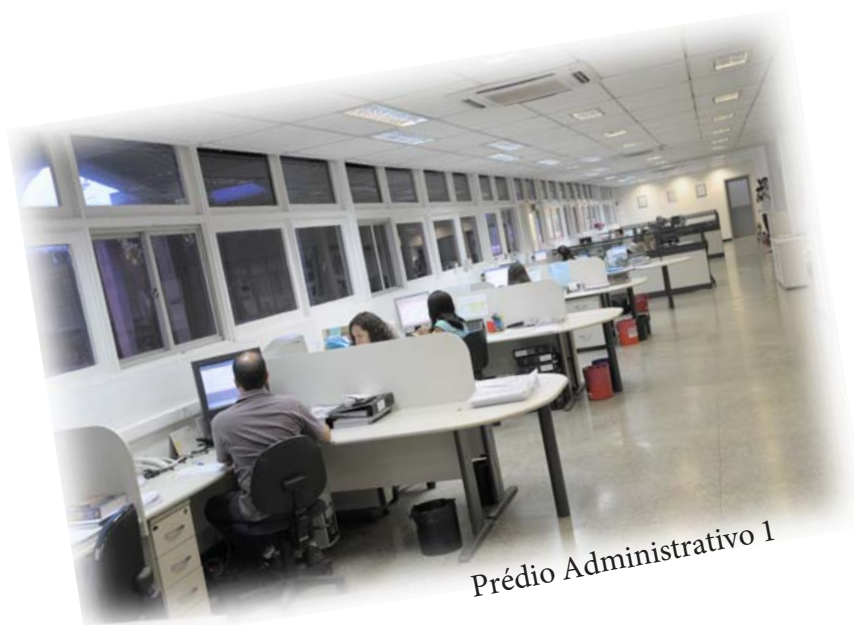
Prédio Administrativo 1